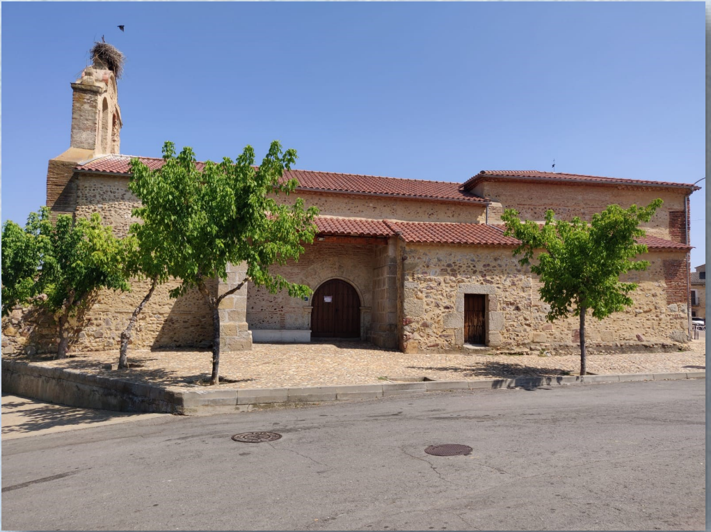
Sancti-Spíritus (IGLESIA VIEJA).