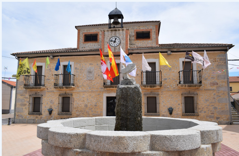
Sancti-Spíritus (Plaza del Ayuntamiento).